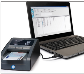
Zählergebnisse auf den PC laden