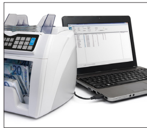
Kompatibel mit der Safescan 2665, 2685, 6155